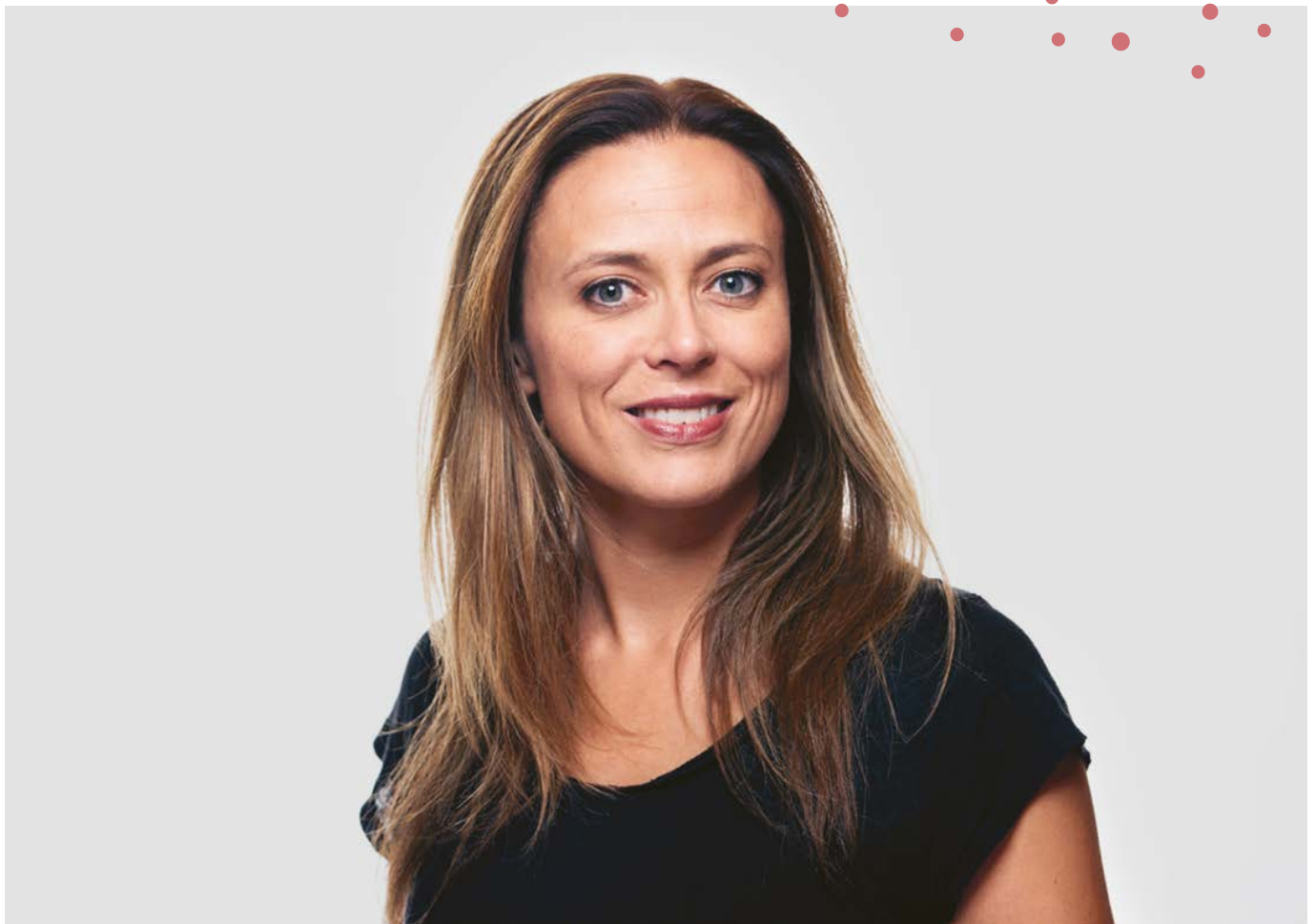
⤴ Skuespiller Ine Jansen